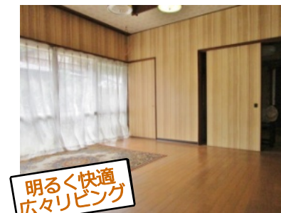
明るく快適 広々リビング