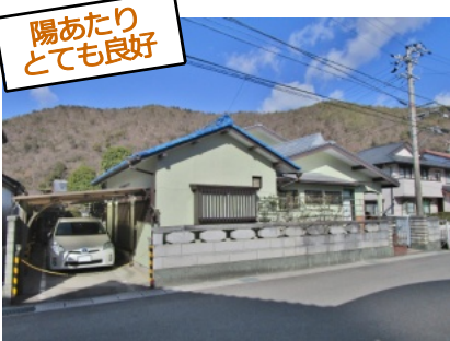
陽あたりとても良好