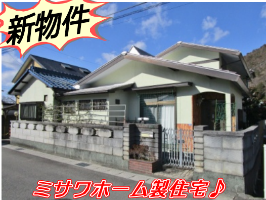
ミサワホーム製住宅♪